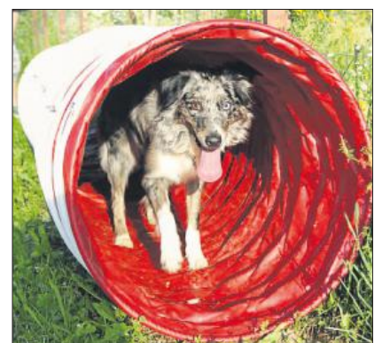
Beim Longieren und Agility laufen die Hunde durch einen Tunnel.