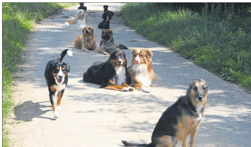
Außerhalb des Geländes lernen die Hunde in der Benimmstunde auch bei Ablenkung ruhig liegenzubleiben.