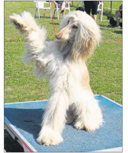
Die afghanische Windhündin „Prace“, winkt auf Kommando beim Trick Dog