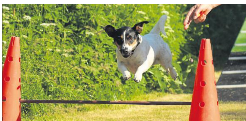
„Die Hürde könnte ruhig höher sein“, sind wohl die Gedanken des Vierbeiners.